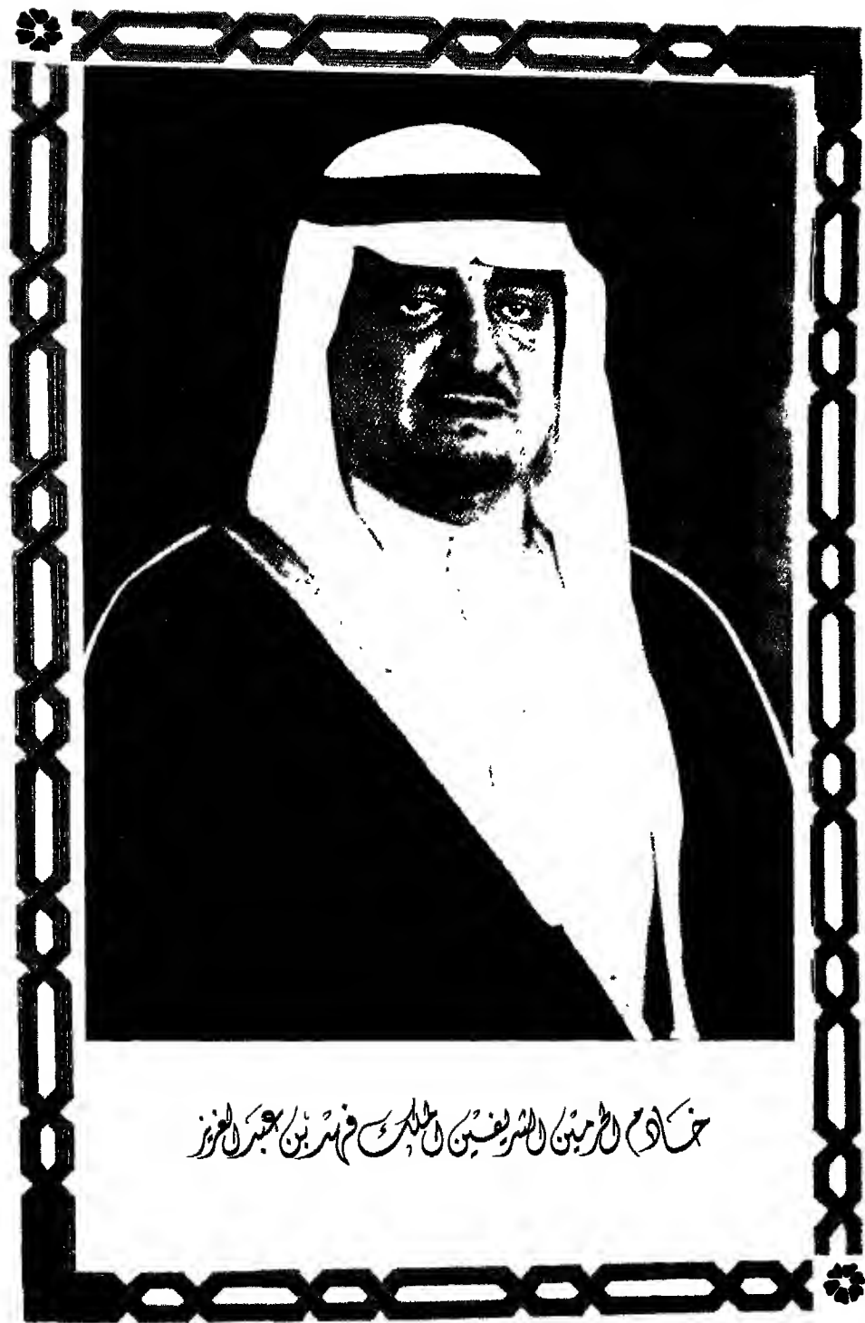
سماحة الشيخ محمد بن عبد العزيز بن عبد الله بن سعود بن عبدالعزيز آل سعود